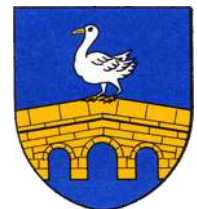
Commune de Lapoutroie